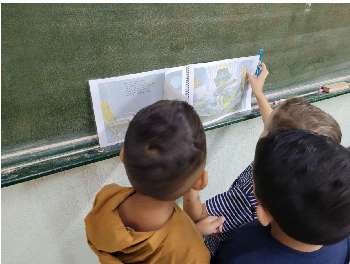
MURAL PRÉ 2-A