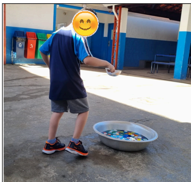
Figura 8: atividade de transferência de tampinhas de um recipiente para outro e contagem.