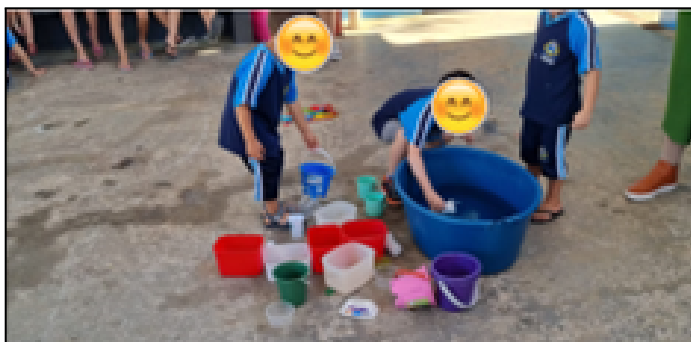
Figura 3: atividade de transferência de água de um recipiente para outro.