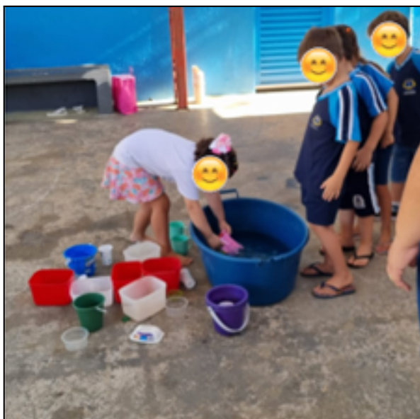
Figura 5: atividade de transferência de água de um recipiente para outro.