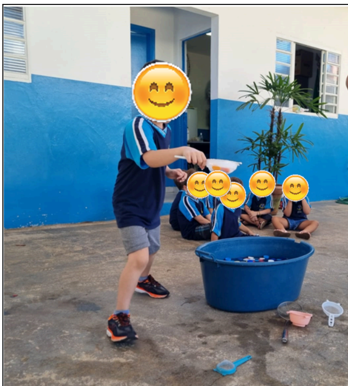
Figura 7: atividade de transferência de tampinhas de um recipiente para outro e contagem.