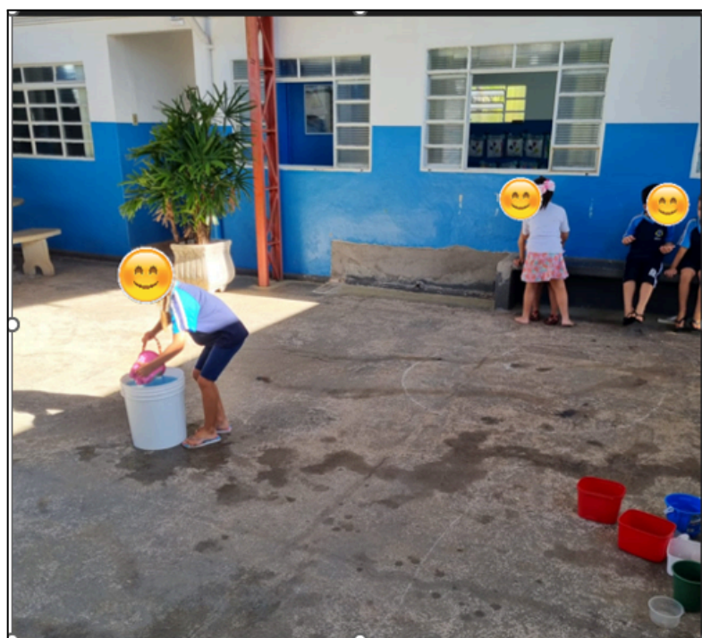
Figura 6: atividade de transferência de água de um recipiente para outro.