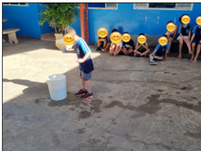
Figura 4: atividade de transferência de água de um recipiente para outro.