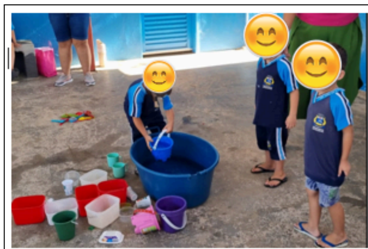
Figura 2: atividade de transferência de água de um recipiente para outro.