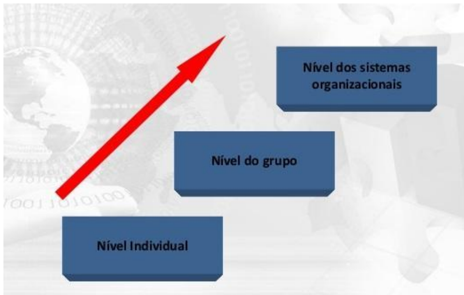
Figura 1 - NÍVEIS DE COMPORTAMENTOS ORGANIZACIONAIS

Existem três níveis de comportamentos organizacionais: