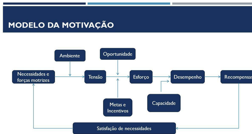
Figura 2- ORGONOGRAMA DE MOTIVAÇÃO

Porém sabemos que é impossível falar em comportamentos sem citar a SATISFAÇÃO. Segundo a Lei do Efeito de Thorndike a satisfação leva à aprendizagem. O princípio da lei do efeito desenvolvida por Edward Thorndike sugere que as respostas seguidas de perto pela satisfação ficarão firmemente ligadas à situação e, portanto, mais propensas a voltar a ocorrer quando a situação se repete. Contudo, é possível entender que toda vez que uma pessoa é estimulada a alcançar um resultado, ela é motivada através de uma recompensa, e quando esse objetivo é atingido, gera a satisfação, deste modo, segundo Thorndike, é possível afirmar que as ações irão se repetir. Assim também ocorre com a desmotivação, toda vez que uma pessoa é punida, ela passa a sentir medo e isso leva a frustração.