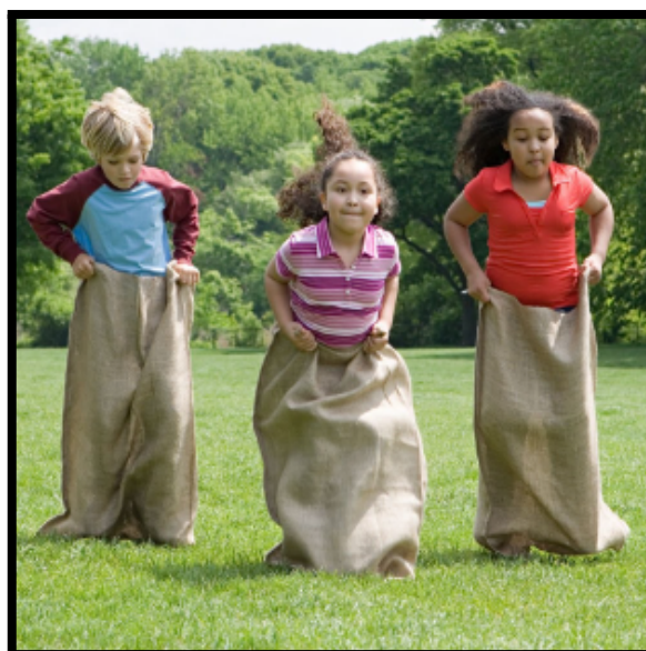
Figura 1: Corrida de Saco.

Um exemplo de brincadeira que pode agregar essa perspectiva de atividade é a CORRIDA DE SACO. O material disposto para esta atividade pode ser adquirido com a própria comunidade, uma vez que é uma embalagem utilizada no meio rural para o transporte de grãos.