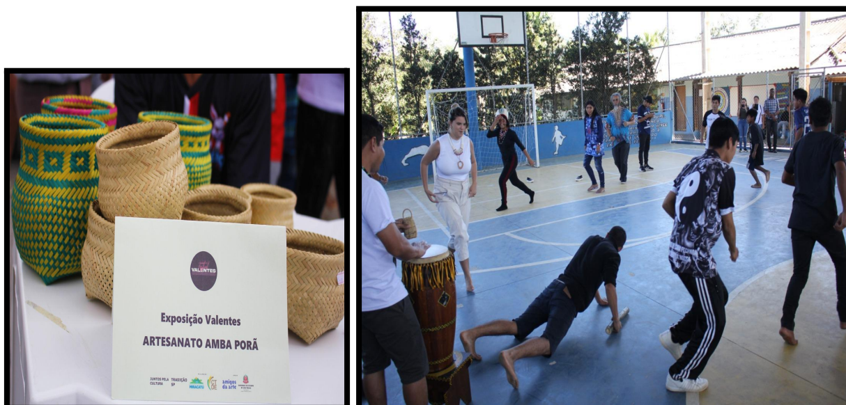
Figura 3: Exposição de artesanatos e dança cultural regional