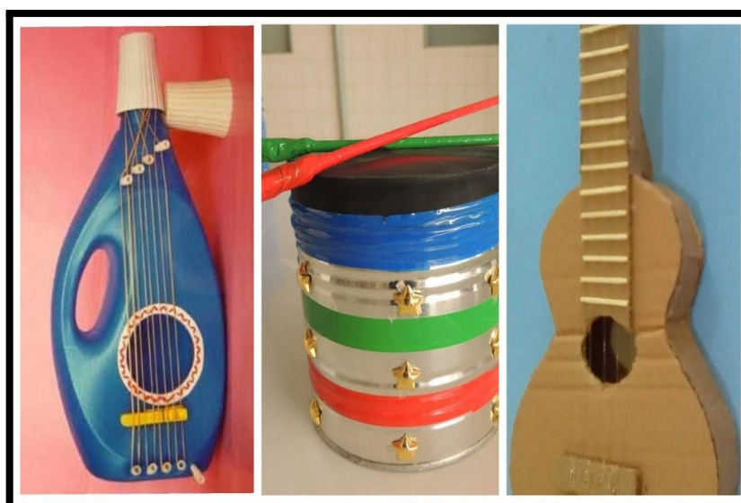
Figura 2: Instrumentos feitos com materiais recicláveis.

A intenção desta proposta é inserir as crianças na criação de instrumentos sonoros estimulando a imaginação e possibilitando situações lúdicas e sucessivas de aprendizagem com enfoque no desenvolvimento inicial da percepção da escuta e da atenção.