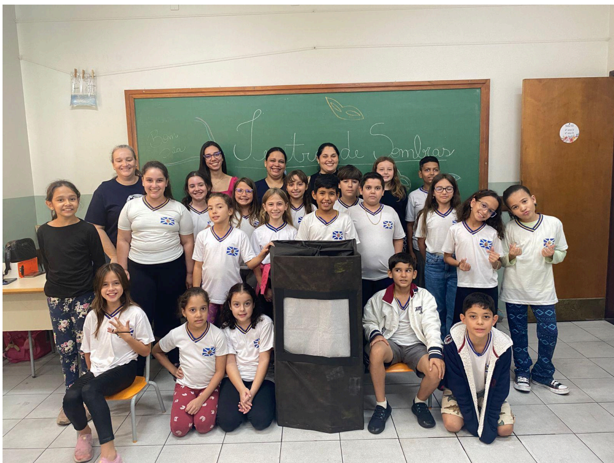
Turma 4º Ano