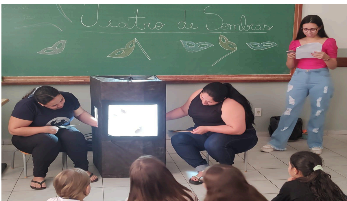
Apresentação do teatro de sombras