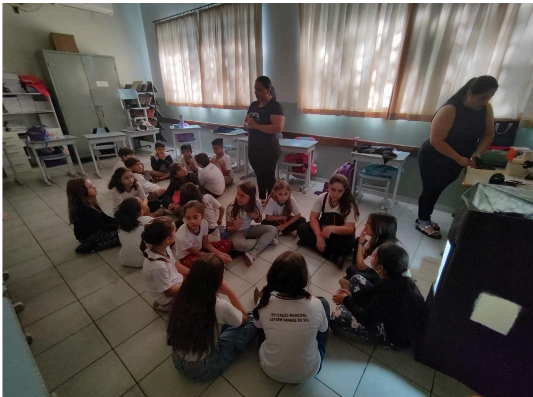
Conversa com as crianças