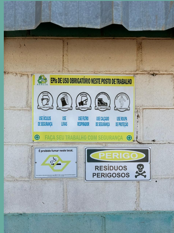
Placas de Aviso.