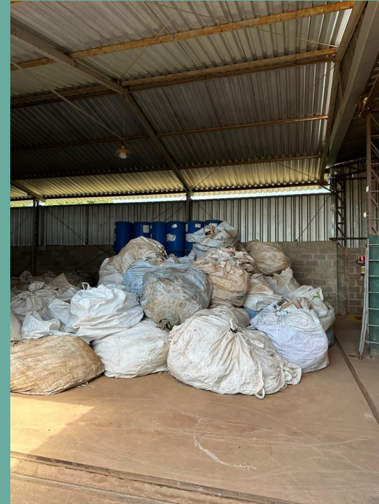
Galpões cobertos para armazenamento dos Big bags