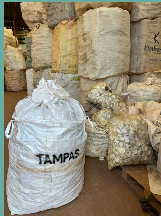
Sistema de armazenamento Big Bag