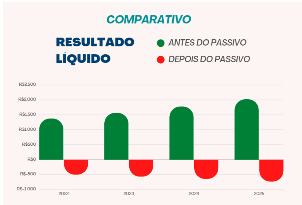
Gráfico 2: Gráfico do Resultado Líquido