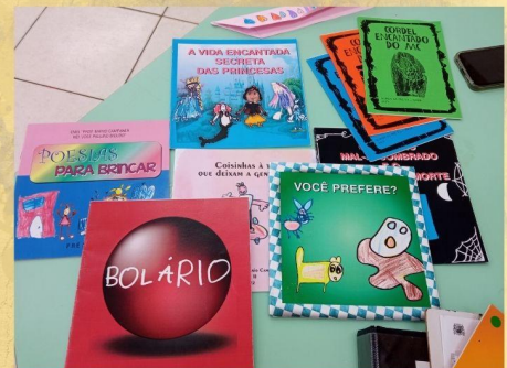
Algumas produções dos alunos realizadas, anualmente, na escola.