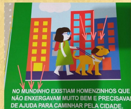
Detalhe do texto e imagem em braille

A ideia do nosso grupo foi que por meio dessa leitura as crianças pudessem ser impactadas e ampliassem o olhar sobre a inclusão, por meio da conscientização, da ludicidade, imaginação, interação e da leitura.