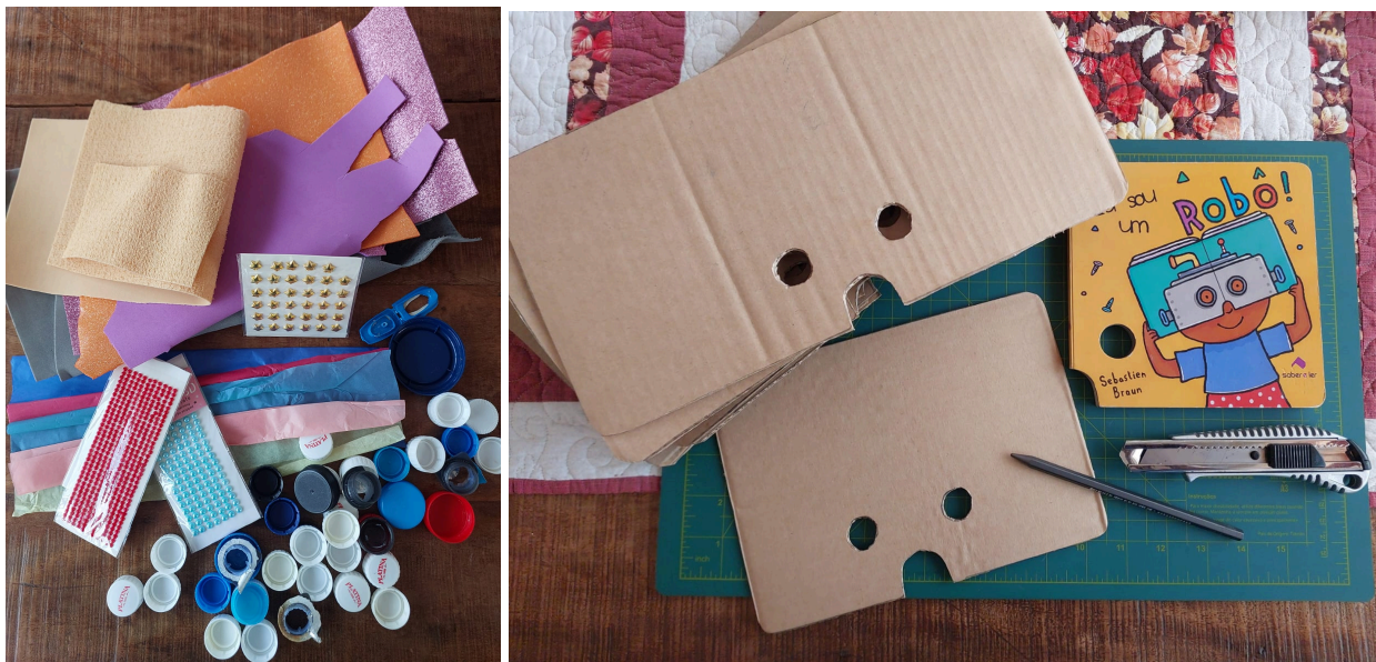
Materiais utilizados no projeto.