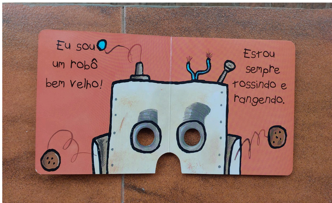
Algumas páginas do livro.