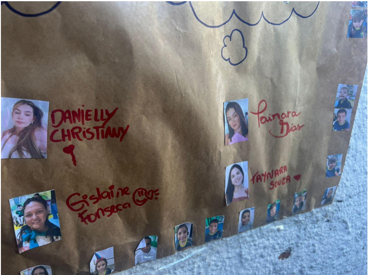
Assinatura das alunas do Curso de Pedagogia EAD - 2025.