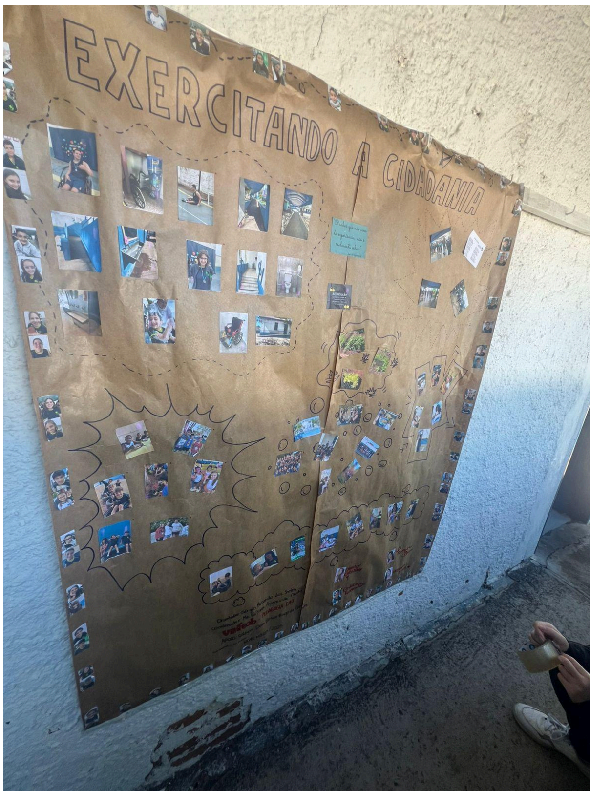
Mural em exposição no colégio.