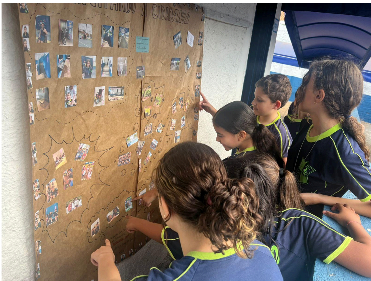
Alunos apreciando o mural.