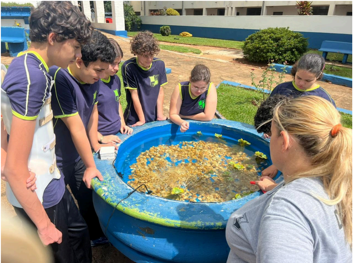
Aquário - com três peixes.