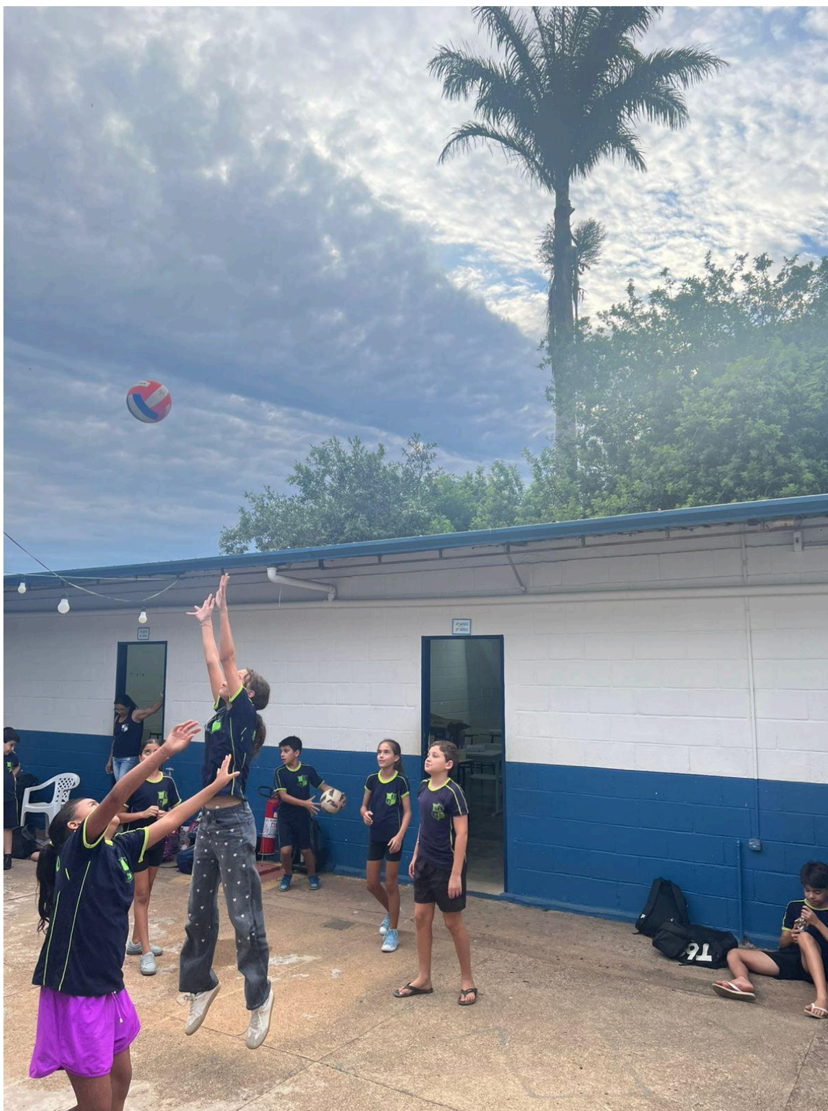
Alunos brincando e a Palmeira Imperial - ao fundo.