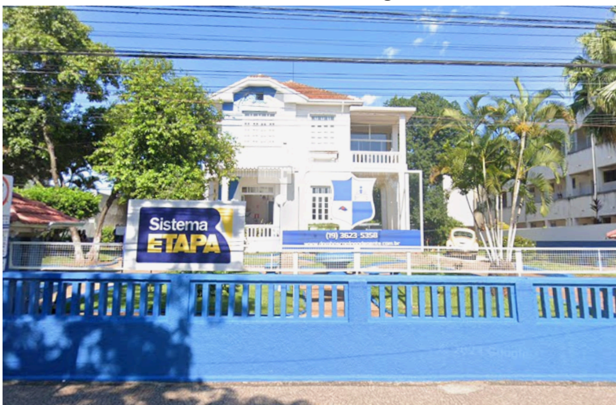
Prédio/sobrado - Patrimônio Histórico de 1924.