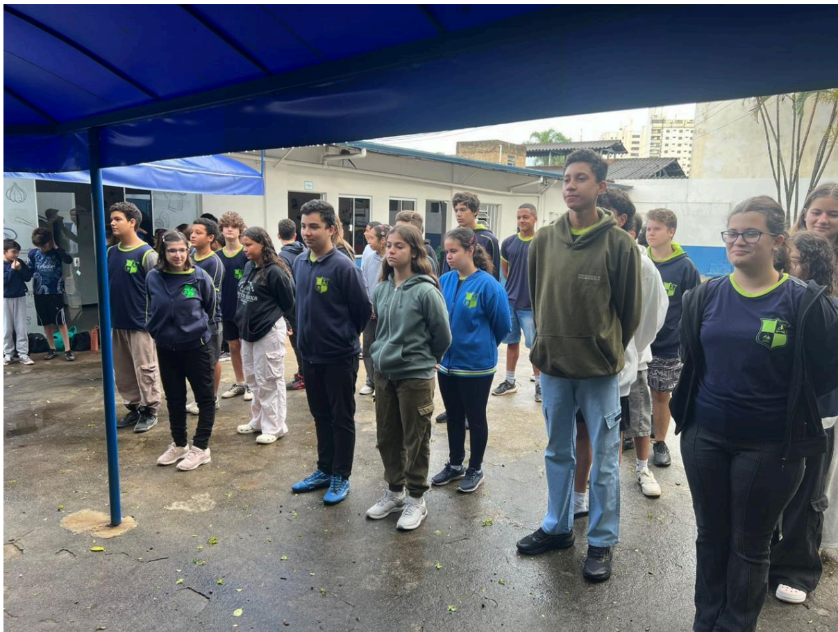
Momento cívico - Hino Nacional e Hino do colégio Dom Bosco.